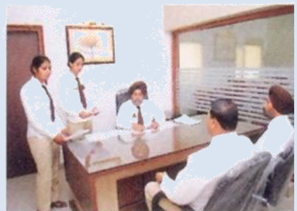
ਸਾਂਝ ਦਾ ਸਟਾਫ ਕੰਮ ਕਰਦੇ ਹੋਏ

10. ਸਾਂਝ ਕੇਂਦਰ ਤਹਿਸੀਲ ਅਤੇ ਪੁਲਿਸ ਥਾਣਾ ਪੱਧਰ ਤੇ ਪੁਲਿਸ ਨਾਲ ਨਾਗਰਿਕ ਦੇ ਜ਼ਿਆਦਾਤਰ ਸੰਪਰਕਾਂ ਲਈ ਇਨ੍ਹਾਂ ਕੇਂਦਰਾਂ ਤੱਕ ਪਹੁੰਚ ਕਰਨ ਲਈ ਹਰੇਕ ਨਾਗਰਿਕ ਨੂੰ ਯੋਗ ਬਣਾਉਣਗੇ, ਜਿਥੇ ਇੱਕ ਟ੍ਰੇਡ ਸਟਾਫ ਸਭ ਤੋਂ ਪਹਿਲਾਂ ਨਾਗਰਿਕ ਨਾਲ ਸੰਪਰਕ ਕਰੇਗਾ, ਜਦ ਕਿ ਪੁਲਿਸ ਥਾਣਾ ਬਾਅਦ ਵਿੱਚ ਸੇਵਾਵਾਂ ਮੁਹੱਈਆ ਕਰਵਾਏਗਾ।