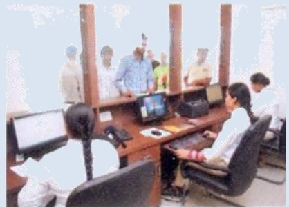
ਸਾਂਝ ਦੀ ਟੀਮ ਲੋਕਾਂ ਦੀ ਮੱਦ ਕਰਦੀ ਹੋਈ

9. ਸਾਂਝ ਕੇਂਦਰਾਂ ਵਿੱਚ ਪਬਲਿਕ ਡੀਲਿੰਗ ਚ ਸ਼ਾਮਲ ਕਮਿਊਨਿਟੀ ਮੈਂਬਰਾਂ ਅਤੇ ਪੁਲਿਸ ਅਧਿਕਾਰੀਆਂ ਨੂੰ ਵੀ ਕਮਿਊਨਿਟੀ ਪੁਲਿਸਿੰਗ ਦੇ ਸਿਧਾਂਤ ਬਾਰੇ ਸਿਖਲਾਈ ਦਿੱਤੀ ਜਾਵੇਗੀ। ਇਸ ਸਿਖਲਾਈ ਵਿੱਚ ਇਹ ਯਕੀਨੀ ਬਣਾਉਣ ਵਿੱਚ ਇੱਕ ਨਿਰੰਤਰ ਪ੍ਰਕਿਰਿਆ ਹੋਵੇਗੀ ਕਿ ਢੁਕਵੀਆਂ ਸਹਿਜ ਨਿਪੁੰਨਤਾਵਾਂ ਅਤੇ ਪ੍ਰਬੰਧਕ ਨਿਪੁੰਨਤਾਵਾਂ ਇਸ ਸਫਲਤਾਪੂਰਵਕ ਲਾਗੂ ਕਰਨ ਲਈ ਸਾਂਝ ਪ੍ਰਾਜੈਕਟ ਦੀ ਹਿੱਸੇਦਾਰੀ ਵਿੱਚ ਵਿਕਸਿਤ ਕੀਤਾ ਜਾਵੇ।